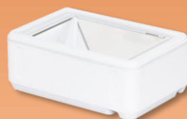
2次元バーコード認証