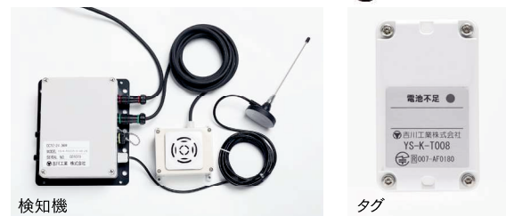
作業員接近検知システム

「ものづくり北九州企業データベース」は 北九州の元気企業が一目でわかるサイトです