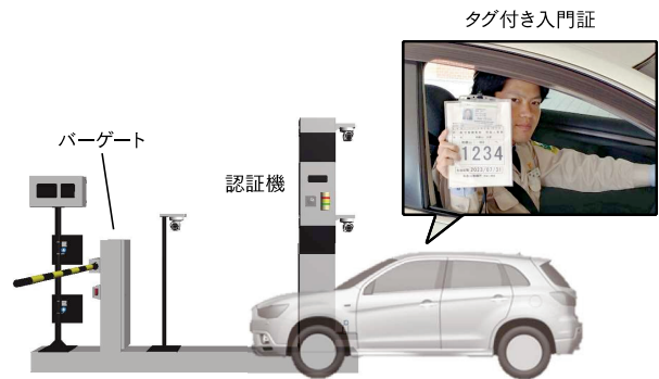
入退門管理システム

今後は、これらシステムのデータを利活用し、お客様がより安全・安心な現場環境を構築するためのソリューションとしてご提案いたします。